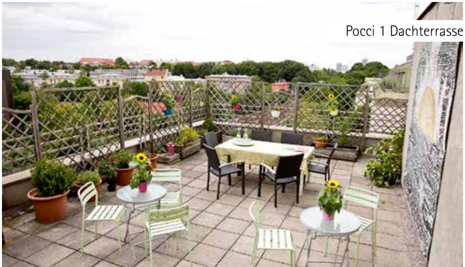
Pocci 1 Dachterasse

Der Umfang des Schulbesuchs bzw. der beruflichen Beschäftigung ist abhängig von der individuellen Belastbarkeit und dem Therapieumfang. Dieser Umfang wird immer wieder im sozialpädagogischen Einzelgespräch besprochen und angepasst.